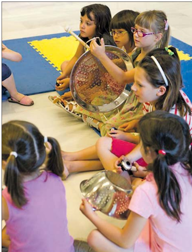
Les activitats educatives compten amb monitors i guies.

La temporada educativa inclou també propostes teatrals per als escolars com és la representació de l'obra: El fil del mite. Mites i tradició oral (21 i 22 d'octubre), una obra que posa l'èmfasi en la narració, per mitjà d'una lleugera dramatització de tres mites clàssics populars: el Minotaure, Teseu i Ariadna i Dèdal i Icar. Per a alumnes d'ESO, també s'han programat dues sessions de teatre-debat titulades Com puc viure amb això? i Ho volia dir, però... que es faran el febrer i que utilitzen el teatre com a eina per analitzar i millorar situacions en què sovint poden trobar-se els adolescents.