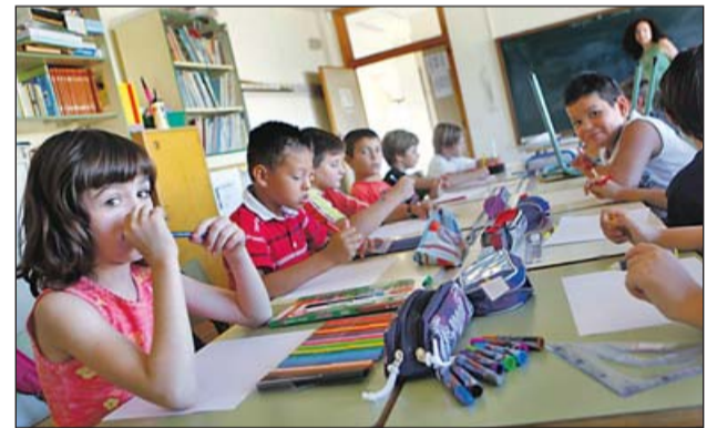
Actualment és una escola de gairebé tres línies.

Nom: COL·LEGI PÚBLIC JOAN VENY I CLAR Nivells d'ensenyament: Educació infantil i primària Adreça: C/ Estrelles, 34-A 07630 - Campos Telèfon i fax: 971 65 21 94 Correu electrònic: cpjoanvenyiclar@educacio.caib.es Web: www.ceipjoanvenyiclar.com Matrícula: 583 (206 EI i 377 EP) Professorat: 40 Serveis: Escola matinerana (6:30-8:30h), transport, menjador (13:30-15h), activitats extraescolars AMPA (dilluns a dijous, de 15 a 17h).