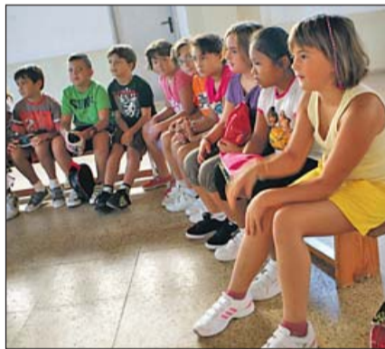
Escolars del centre campaner.