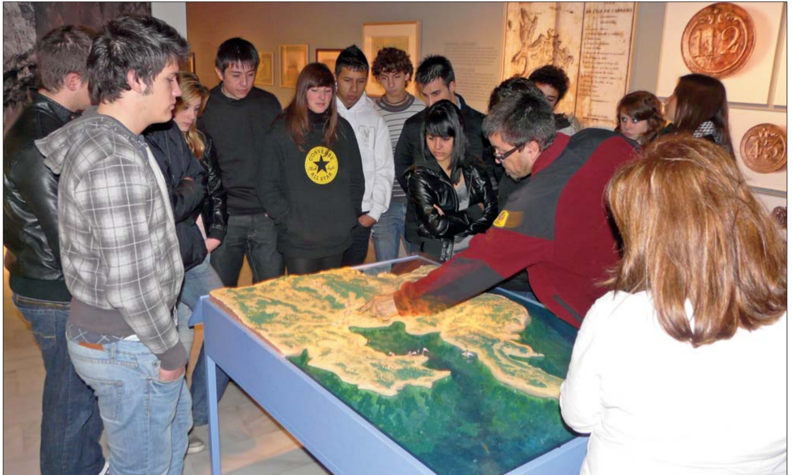
Les visites guiades a les exposicions continuaran sent un referent del CaixaForum. A la imatge, alumnes de l'IES Juníper Serra a la mostra 'Oblidats de Cabrera' el curs passat.

Música, ciència, teatre, educació en valors, cooperació internacional, literatura i visites a les exposicions configuren l'amplia oferta educativa del CaixaForum de Palma