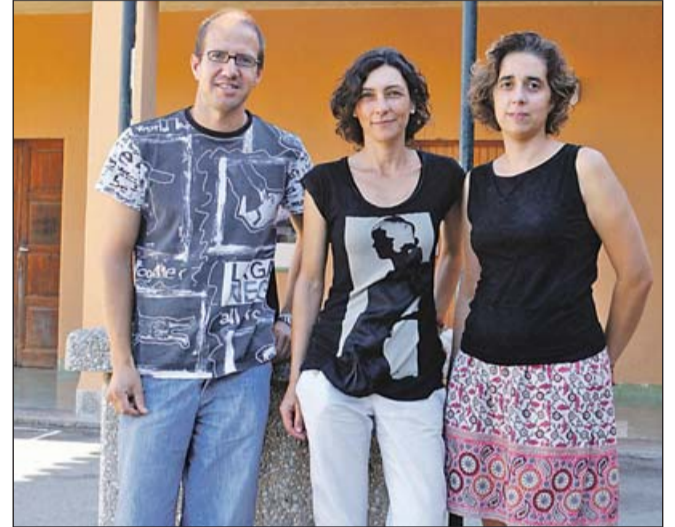
L'equip directiu del centre.