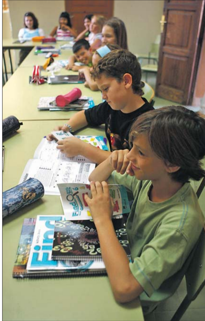
Un grup d'alumnes d'aquest centre a la seva aula.

-Malgrat les dificultats tècniques, de manca d'espai i de personal, l'escola inicia amb ganes nous projectes: Un d'innovació pedagògica: Xarxipèlag 2.0 i una Secció Europea. Continuarem amb el de suport a la lectoescriptura i esperam la concessió del Pla Europeu de Consum de Fruita.